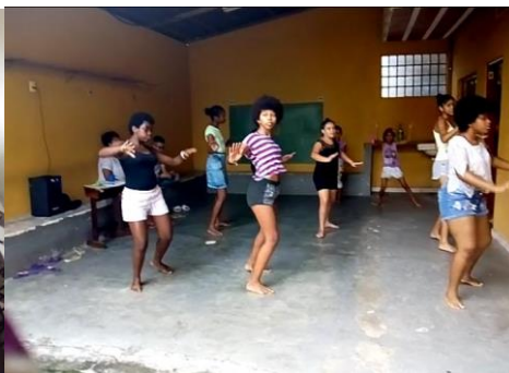
Groupe de dance Afro