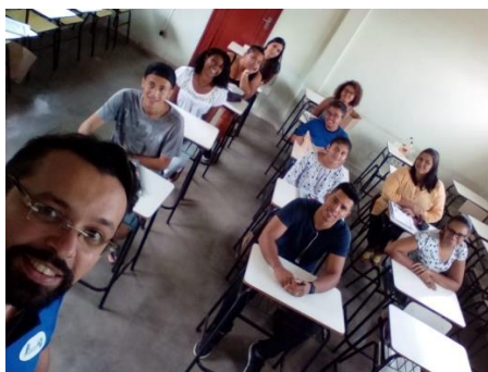
Groupe d'étudiants en français